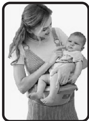
Подходящо за деца от 4 до 36 месеца