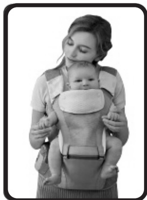
Подходящо за деца от 4 до 36 месеца