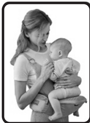
Подходящо за деца от 6 до 36 месеца

! ПРИ ИЗПОЛЗВАНЕ НА ЛЕЖАЩО ПОЛОЖЕНИЕ, ВИНАГИ ПОДКРЕПЯЙТЕ ДЕТЕТО С РЪКА!