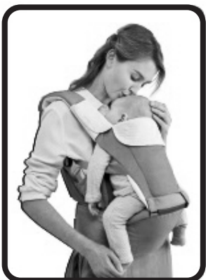
Подходящо за деца от 4 до 36 месеца