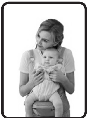
Подходящо за деца от 6 до 36 месеца