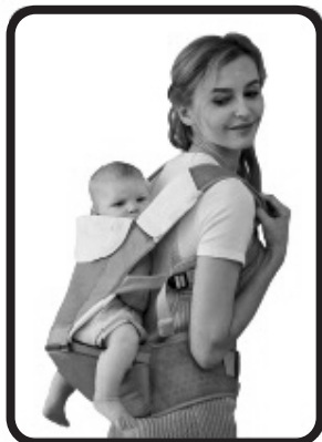
Подходящо за деца от 6 до 36 месеца